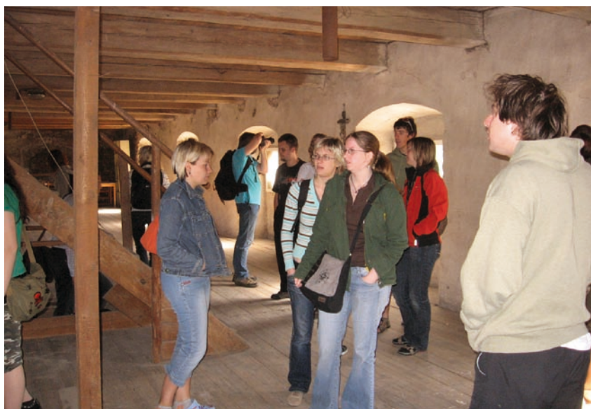
Studenti pro venkov