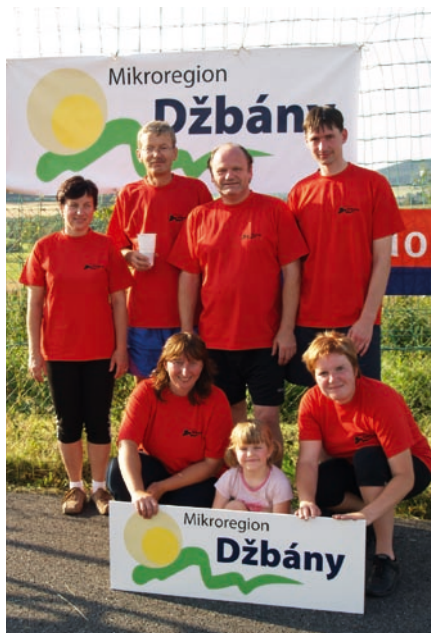
Volejbalový turnaj v Načeradci

Během odpoledne si spolu zahrála všechna družstva. A jak to celé dopadlo? Vítězem se stal svazek obcí Blaník, na druhém místě skončilo Malé Posázaví a na třetím místě jen s minimálním rozdílem Mikroregion Džbány. Boj to byl náročný, výkony družstva Mikroregionu Džbány a Malého Posázaví byly velmi vyrovnané a o konečném pořadí nerozhodl ani vzájemný zápas mezi nimi. Mikroregion Džbány se umístil na třetím místě jen kvůli nižšímu součtu bodů ze všech odehraných zápasů.