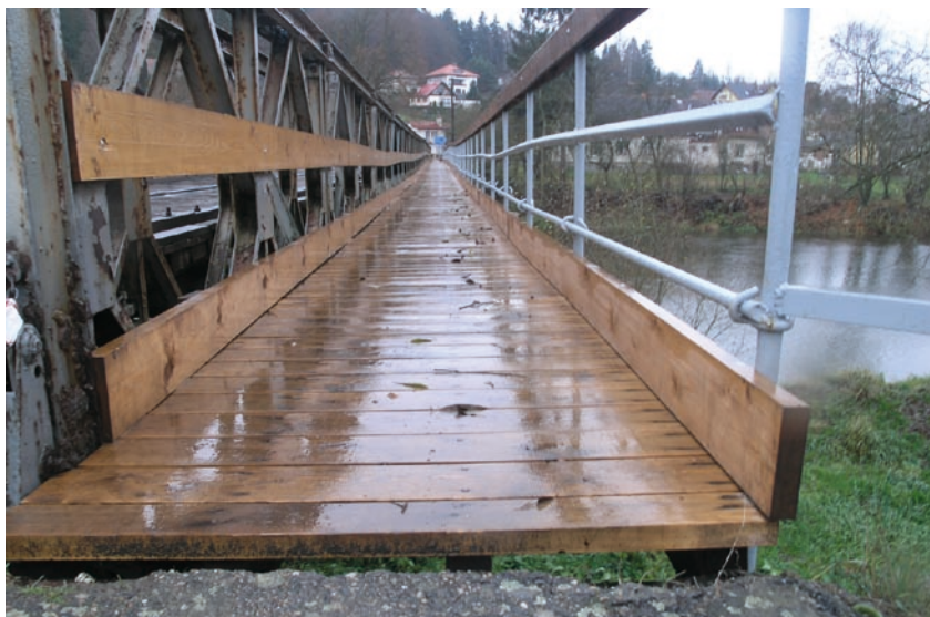
Oprava lávek pro pěší na mostě mezi obcemi Čtyřkoly a Lštění

základní školy v Choceradech financované z Operačního programu životního prostředí a rozsáhlá rekonstrukce náměstí ve Stříbrné Skalici podporovaná Regionálním operačním programem Střední Čechy. První dva projekty by měly být ukončeny na podzim roku 2009 a náměstí ve Stříbrné Skalici až v roce 2010.