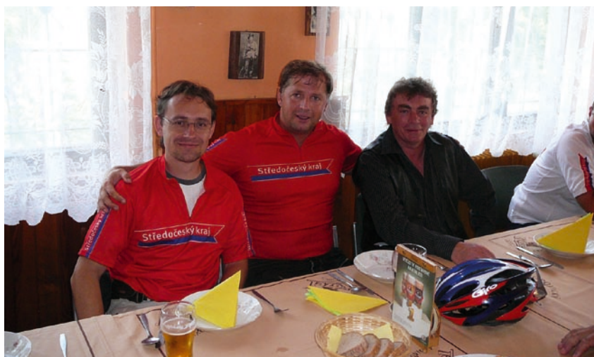
Putování s hejtmanem po území svazku obcí CHOPOS

Na sportovním poli se region prezentoval účastí na volejbalovém turnaji pořádaném Mikroregionem Blaník v Načeradci. CHOPOS se zde umístil na pěkném pátém místě ze šesti.