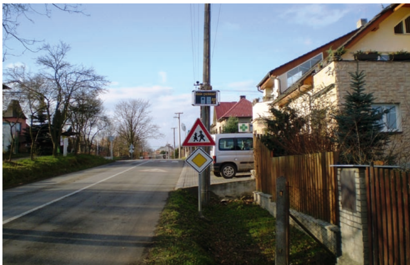
Senohraby – bezpečná cesta do školy