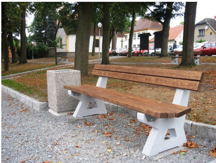
Vybavení veřejných prostranství Mikroregionu Džbány mobiliářem