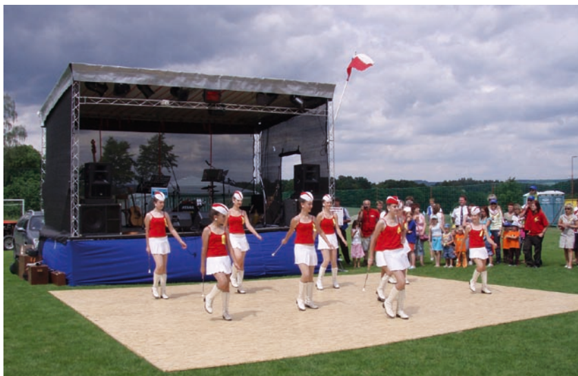
Přestavky u Čerčan – oslavy